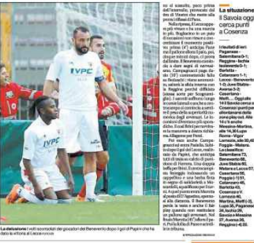
La delusione: i sei giocatori del Benevento dopo il gol di Paoletti che ha fatto la differenza.

LECCO Il Benevento perde il derby con il Posillipo per 1-3. Inutile il Paoletti che nell'ultimo quarto di partita espulso con un rigore su un calcio sbagliato. Bello il primo gol, realizzato da un attaccante che ha fatto il tifo per la Lazio. Il Benevento si era difeso bene, ma l'espulsione di Paoletti ha fatto la differenza. Il Posillipo ha segnato tre gol, il primo con un rigore di Gallo, il secondo con un tiro di Radovic, il terzo con un tiro di Klikovac.