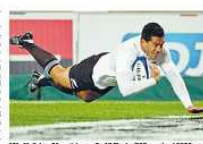
Muliaina, 34 anni, in maglia All Blacks (100 cap) nel 2009